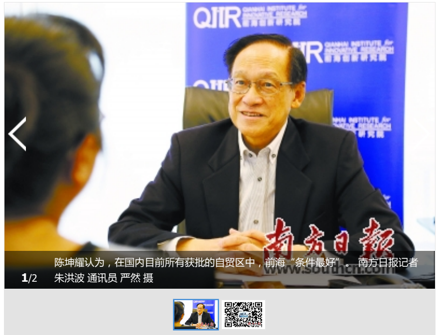
陈坤耀认为，在国内目前所有获批的自贸区中，前海“条件最好”。

年过七十的陈坤耀平均每周有两天时间在前海。这位香港著名经济学家自两年前首度北上出任前海创新研究院首任院长后，已把1/3的时间贡献在这里，剩下的时间留给了香港大学董事会和其他大学有关工作，以及四五家上市公司的独立董事等职务。