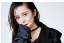
明星见偶像秒变脑残粉