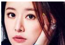
6招轻松去除红血丝