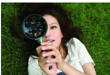
盘点30位未婚先孕的...