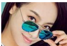
宋茜演技捉急颜值在线