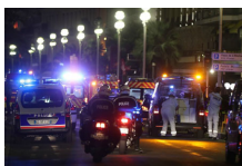
法国尼斯市国庆日庆...