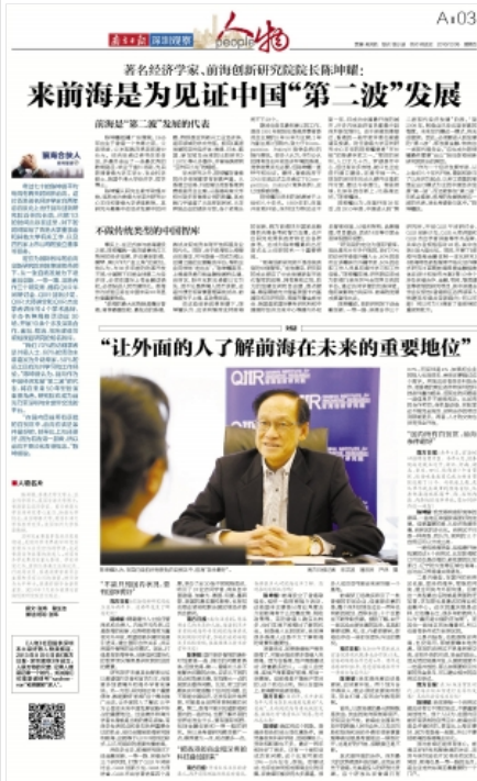
第SC03版：深圳观察·人物